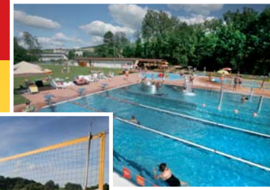
● koupaliště (vzd. 100 m)