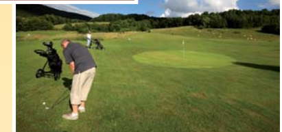
● golfové hřiště (vzd. 1200 m)