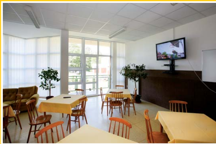
● společenská místnost

City tourist hostel offers double rooms to ten-bed rooms with hot and cold water. There is also a dayroom with a TV set and a satellite receiver. There is a wide choice of indoor and outdoor sports facilities in the hostel vicinity including an outdoor swimming pool with a beach volleyball court, an indoor swimming pool, a sports hall, tennis courts, a winter stadium, an outdoor playground and a football stadium with artificial grass.