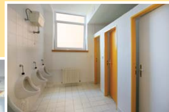
● sociální zařízení