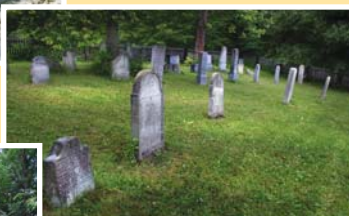
● židovský hřbitov