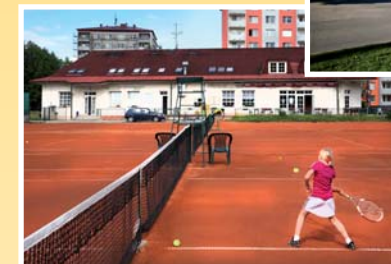
● tenisové kurty (vzd. 350 m)