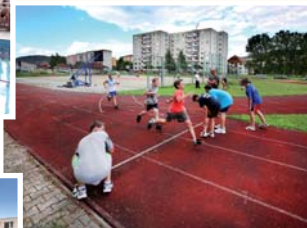
● víceúčelové hřiště (vzd. 250 m)