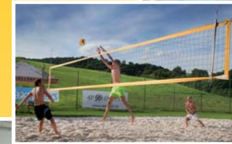
● hřiště na plážový volejbal (vzd. 100 m)