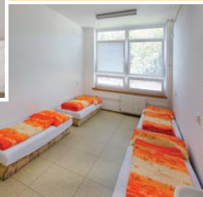
● čtyřlůžkový pokoj