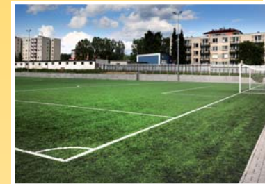
● fotbalový stadion (vzd. 50 m)