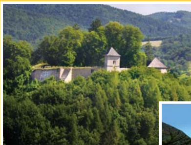
● hrad Brumov