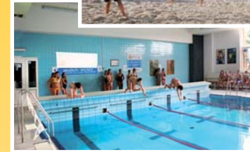
● plavecký bazén (vzd. 150 m)