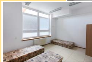
● třílůžkový pokoj