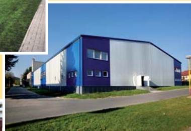
● hokejová hala (vzd. 150 m)