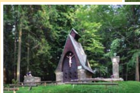
● hložecká kaple