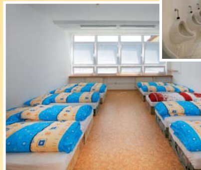
● osmilůžkový pokoj