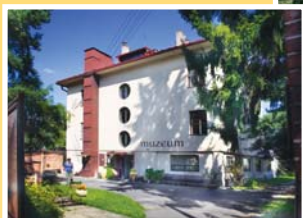
● městské muzeum