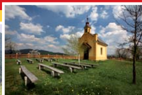
● kaple sv. Anny