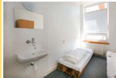
● dvoulůžkový pokoj